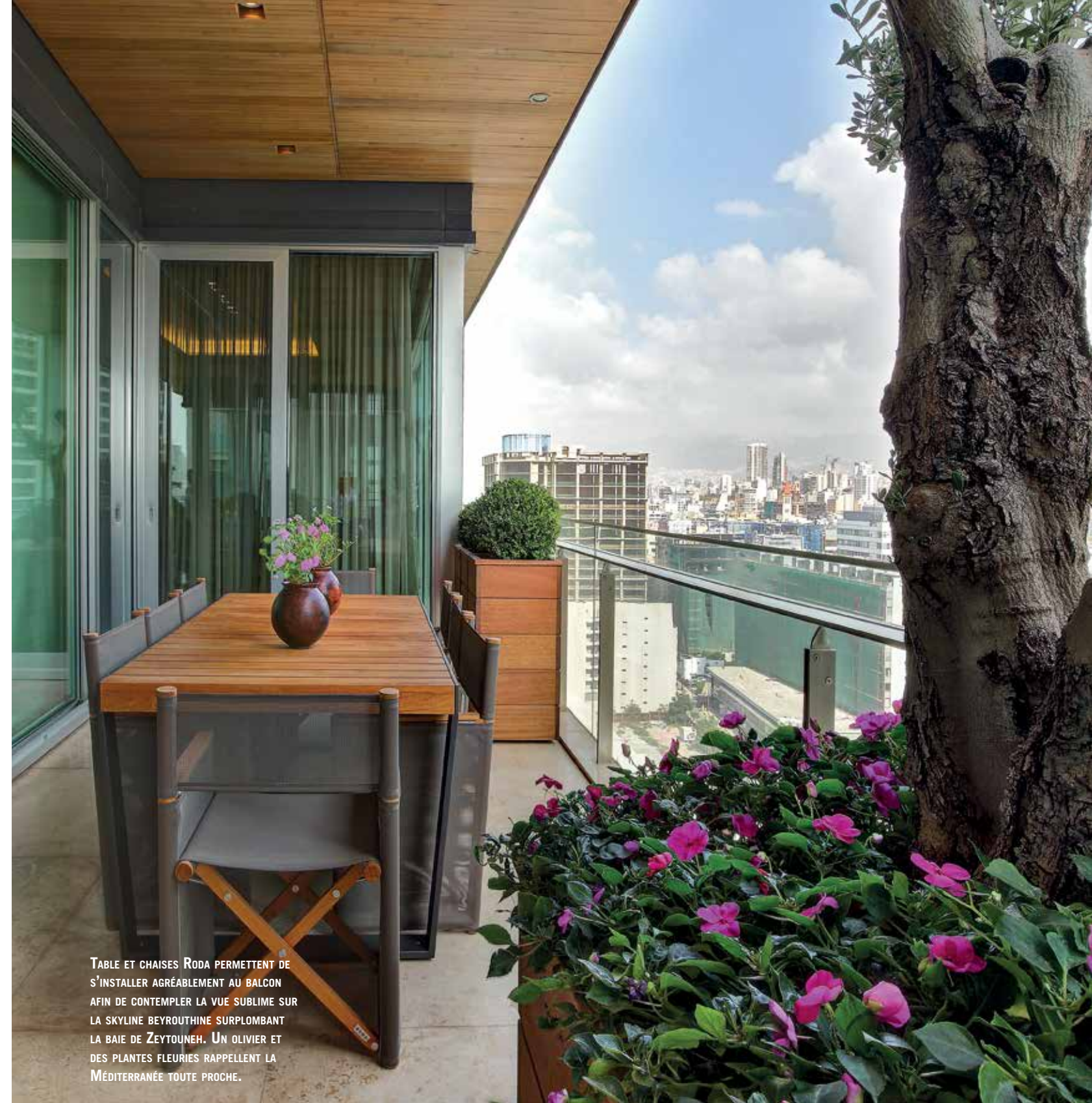
TABLE ET CHAISES RODA PERMETTENT DE S'INSTALLER AGRÉABLEMENT AU BALCON AFIN DE CONTEMPLER LA VUE SUBLIME SUR LA SKYLINE BEYROUTHINE SURPLOMBANT LA BAIE DE ZEYTOUNEH. UN OLIVIER ET DES PLANTES FLEURIES RAPPELLENT LA MÉDITERRANÉE TOUTE PROCHE.

DES TOUCHES DE COULEURS VITAMINÉES CONTRASTENT AVEC LE NOIR ET LE BLANC DE LA CUISINE POGGENPOHL.