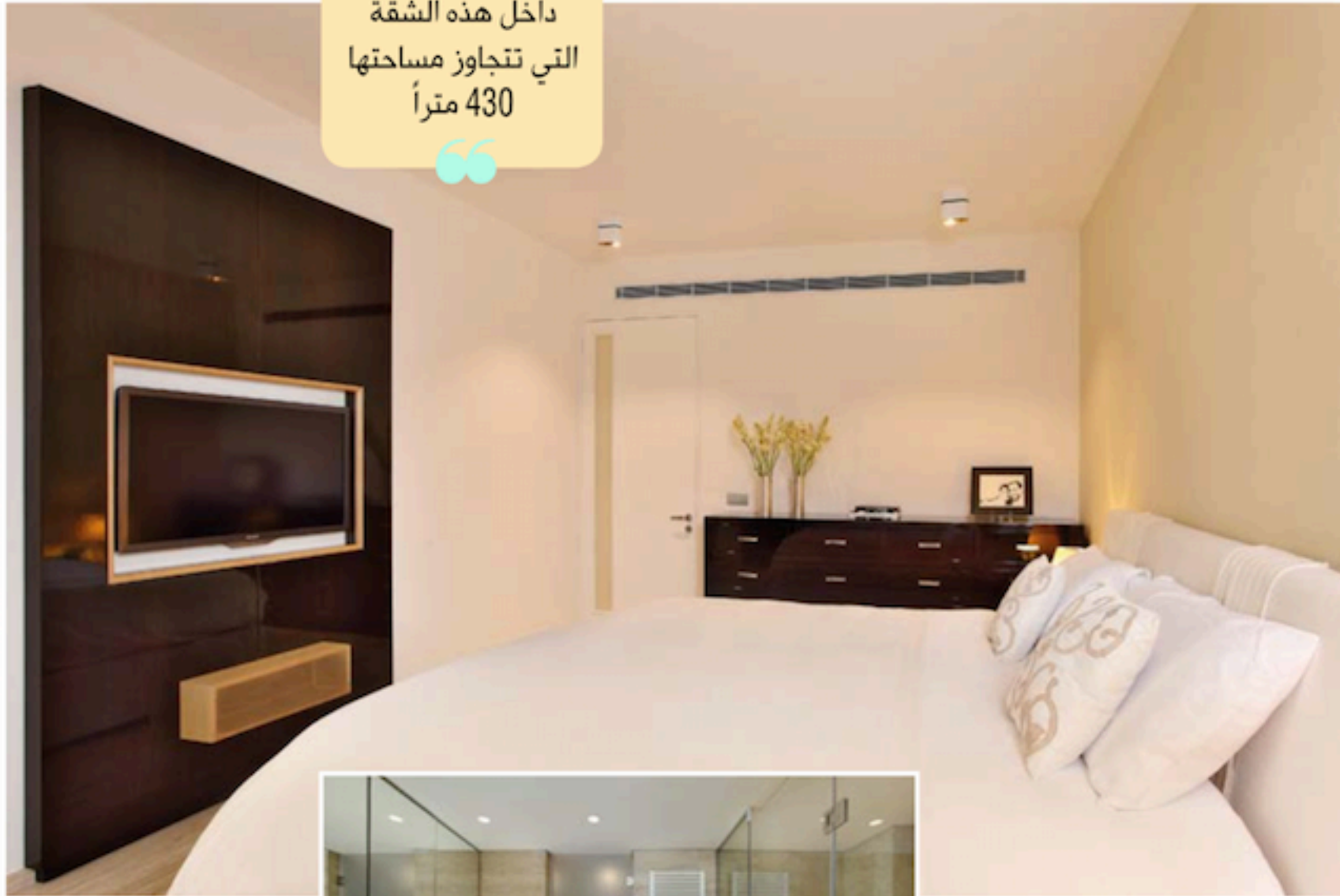
غرفة النوم الرئيسية

أعيد توزيع الغرف داخل هذه الشقة التي تتجاوز مساحتها 430 متراً